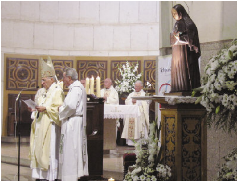
◀ El Cardenal Rouco, en Madrid.